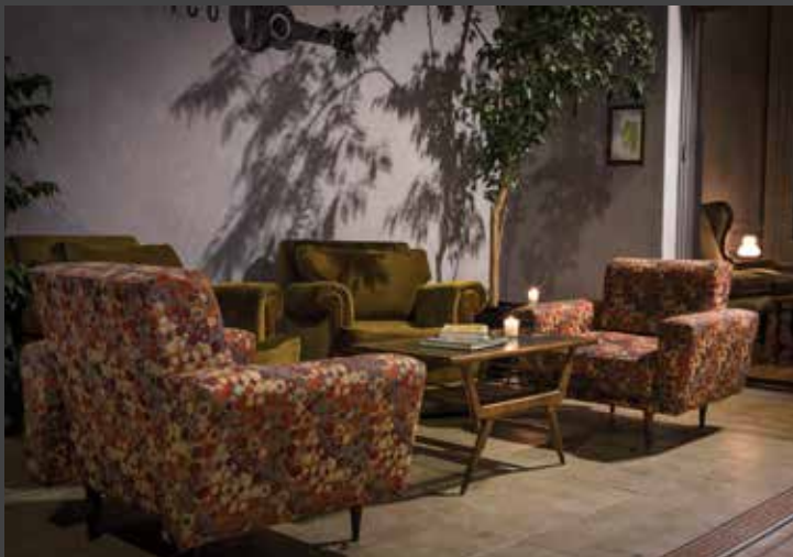
JARDIN DE INVIERNO